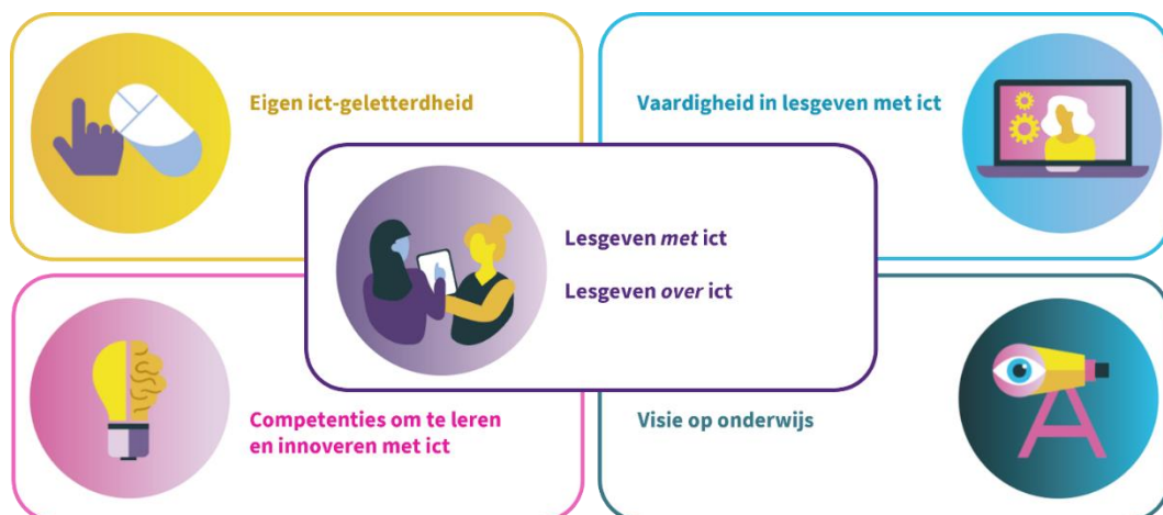
Onderzoeksmodel monitor Leren en lesgeven met ict

De monitor Leren en lesgeven met ict is een beproefd instrument, ontwikkeld en uitgevoerd door het iXperium Centre of Expertise Leren met ict (iXperium). In 2022 en 2023 hebben al 41 mbo-instellingen deelgenomen. In samenspraak met MBO Digitaal, het programma 'Digitaal Bekwaam' en het iXperium krijgen mbo-instellingen in 2024 weer de kans deel te nemen. Er zijn geen kosten verbonden aan deelname.